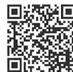
クレオ大阪 講座申込システム (講座名を入力してください)